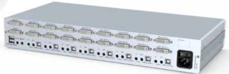
links: DVIMUX8-OSD-MC2-USB - Frontansicht rechts: DVIMUX8-OSD-MC2-USB - Rückansicht