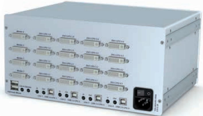
links: DVIMUX4-MC4-USB - Frontansicht rechts: DVIMUX4-MC4-USB - Rückansicht