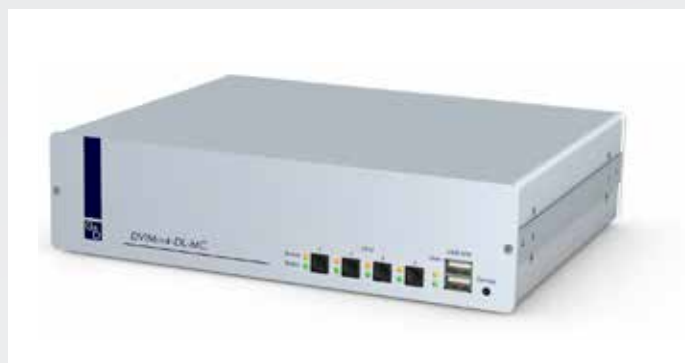
DVIMUX4-MC2-PS/2 - Frontansicht