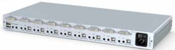
links: DVIMUX8-OSD-USB - Frontansicht rechts: DVIMUX8-OSD-USB - Rückansicht