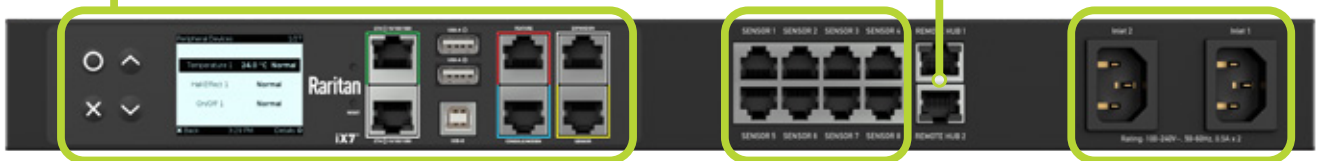
Modell gezeigt: SRC-0800

Diese Anschlüsse am SRC ermöglichen es Ihnen, zwei Remote-Hubs anzuschließen, wodurch Sie Zugang zu 8 zusätzlichen Sensoranschlüssen erhalten. Jeder Hub und die angeschlossenen Sensoren können bis zu 50 m (150 ft) vom Gerät entfernt platziert werden, wodurch die Abdeckung auf die Orte erweitert wird, an denen Sie sie benötigen.